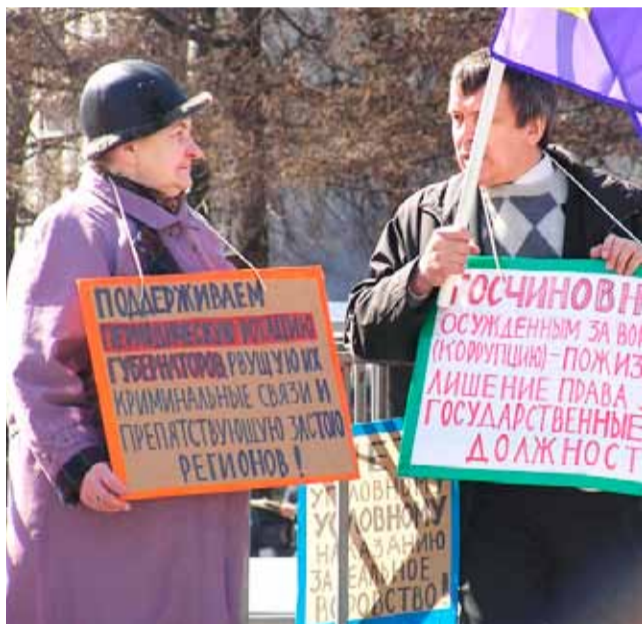
К мартовским выборам были приурочены акции социального протеста

Чтобы склонить молодых избирателей к голосованию за партию власти брянские члены «Еди-