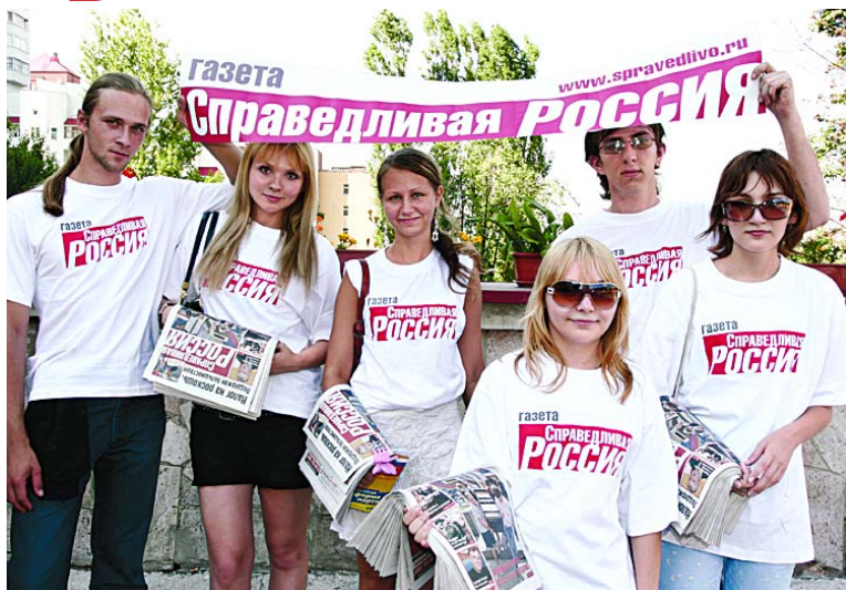
Дни газеты «Справедливая Россия» Белгород