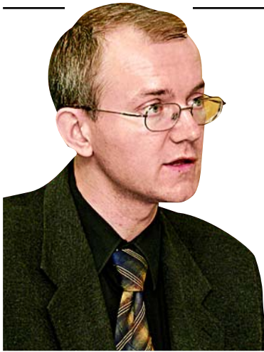
Олег Шейн, депутат Госдумы, член Президиума Центрального Совета партии «Справедливая Россия»

Владимир Путин обратился к стране с посланием, текст которого можно назвать почти социалистическим. Он заявил о том, что необходимо прекратить сжигать деньги в Стабфонде и начать широкую социальную политику: повысить зарплату и пенсии, выполнить государственные обязательства по капитальному ремонту жилого фонда, переселить людей из ветхого жилья в приличные дома, привести в порядок дороги. Текст этого послания оказался очень воодушевляющим для всех, кто живет на зарплату, и возникает только один вопрос: какие препятствия могут возникнуть на пути реализации поставленных задач? Возьмем только два из них, на мой взгляд, наиболее важные.