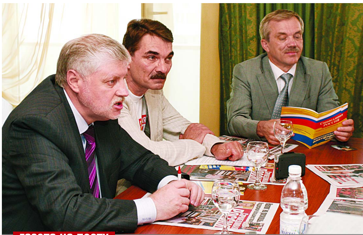
газета на посту

В ходе рабочего визита в Белгородскую область 12 июля спикер Совета Федерации и лидер партии «Справедливая Россия» Сергей Миронов побывал на состоявшемся в этот же день фестивале партийной газеты.